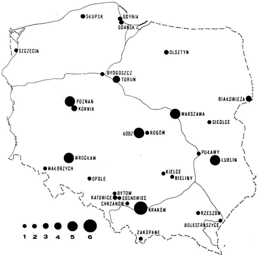
Ryc. 1. Liczba zielników założonych w różnych okresach; polskie zbiory oznaczono ciemnymi polami na tle zbiorów światowych.