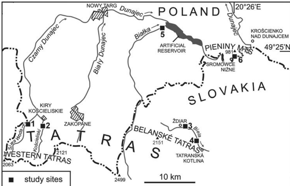
Ryc. 1. Rozmieszczenie stanowisk badań gatunków z rodzaju Didymosphenia (1 – potok Siwa Woda, 2 – potok Kościeliski, 3–4 potok Biela, 5 – rzeka Białka, 5 – rzeka Dunajec)

Okrzemki zebrano w potokach: Kościeliski (dolina Kościeliska), Siwa Woda (dolina Chochołowska) i Biela oraz w rzekach Białka i Dunajcu w latach 2004–2005 (w okresie od czerwca do listopada). Lokalizację miejsc poboru prób przedstawiono na rycinie 1. Materiał algologiczny zależnie od warunków pobierano siatką planktonową lub też przy użyciu plastikowego pojemnika. Ponadto pobierano zanurzone części makrofitów i pojedyncze, drobne kamienie. Łącznie uzyskano około 70 prób, które oznaczano w stanie żywym, a następnie zebrany materiał algologiczny utrwalało 4% formaliną. W celu uwidocznienia struktury zewnętrznej krzemionkowych pancerzyków okrzemek, w laboratorium część materiału poddawano działaniu kwasu HCl, następnie materiał przepłukiwano kilkakrotnie wodą destylowaną, po czym wprowadzano H_2O_2 z niewielką ilością KClO_3 . Obserwacje przeprowadzono w mikroskopie świetlnym Nikon Y-QT oraz skaningowym Jeol 5410 Hitachi.