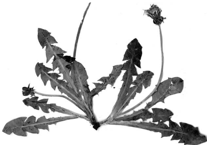
Ryc. 2 (Fig. 2). Taraxacum corpulentum Rail.

POJEZIERZE CHELMIŃSKIE: DC1211 , Zieleń, wilgotna łąka, 9.05.2001, leg. Z. Głowacki, det. H. Øllgaard (Ryc. 2).