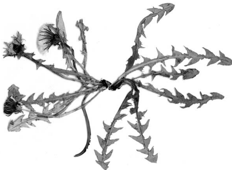
Ryc. 3 (Fig. 3). Taraxacum freticola H. Øllg.