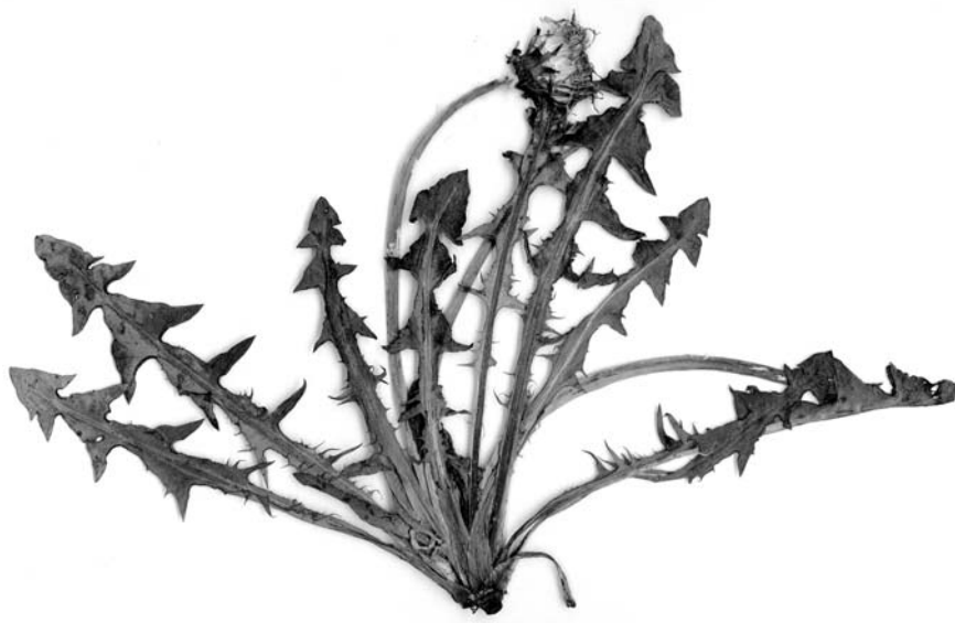
Ryc. 1 (Fig. 1). Taraxacum calochroum Hagend., Soest & Zevenb.

POJEZIERZE CHEŁMIŃSKIE: DC1211 , Zieleń, łąka, 9.05.2001, leg. Z. Głowacki, det. P. Oosterveld et A. Hagendijk (Ryc. 1).